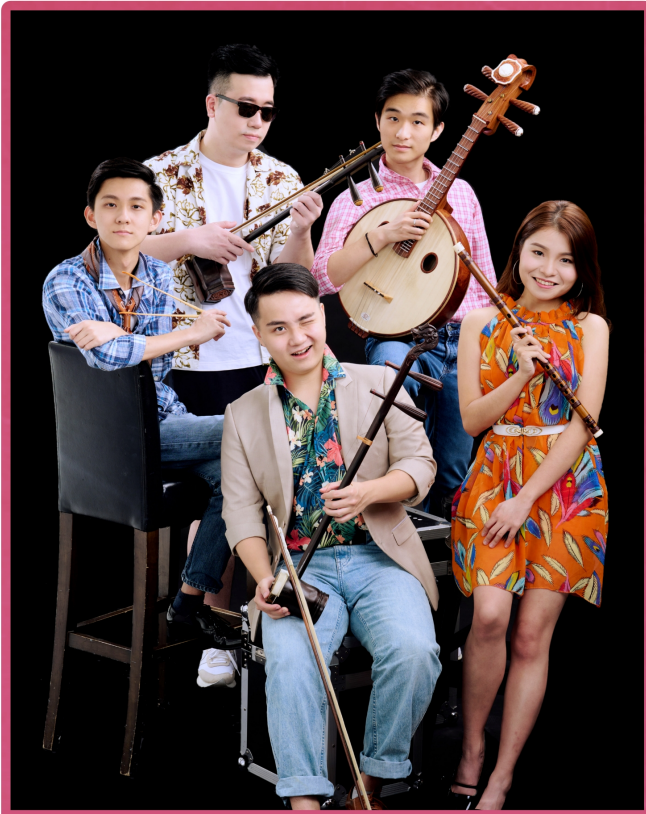
▲ 伍人粵 Band - TroVessional

二零二三社區文化大使 Community Cultural Ambassador 2023