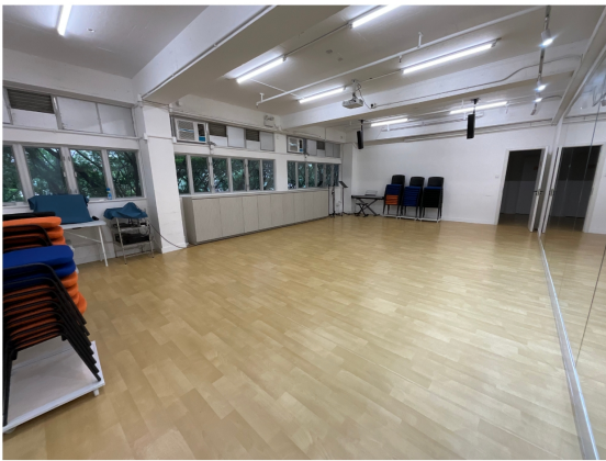
▲ 地點：藝行坊（大埔藝術中心1樓108室）

各位老友記，一同成為說唱藝人！參加者將在十節課堂中體驗演唱、伴奏（能演奏樂器者）和創作南音。任何內容經由老師指導，均可用南音演唱出來。完成工作坊後，參加者更有機會於總結音樂會上發佈其作品。